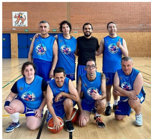
Fotografia 12 i 13: Equips del Sènior Mixte del CB Adepaf amb l'equipació de l'equip patrocinat per MRW.