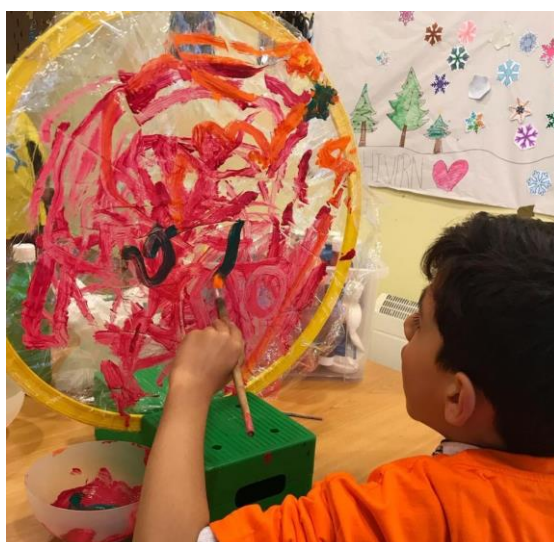
Fotografia 9: Tallers creatius

Els tallers creatius han tingut lloc els dissabtes de 10:30 a 12:30h del matí, al local del Dofí. Aquest any els tallers creatius només s'han pogut realitzar de Gener fins la primera setmana de Març degut a la situació derivada de la Covid-19. En aquesta activitat hi han participat fins a un màxim de 8 usuaris.