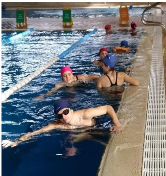
Fotografia 14: Activitat de piscina

Aquesta activitat s'ha realitzat a la Piscina Municipal de Figueres un dissabte al mes durant la temporada d'hivern. Degut a la COVID-19 aquesta activitat només s'ha pogut realitzar el mes de Gener i Febrer. El número de participants a l'activitat és variable, tot i això hi ha participat un total de 14 usuaris diferents amb una mitjana de 9 usuaris/es per sessió (Fotografia 9).