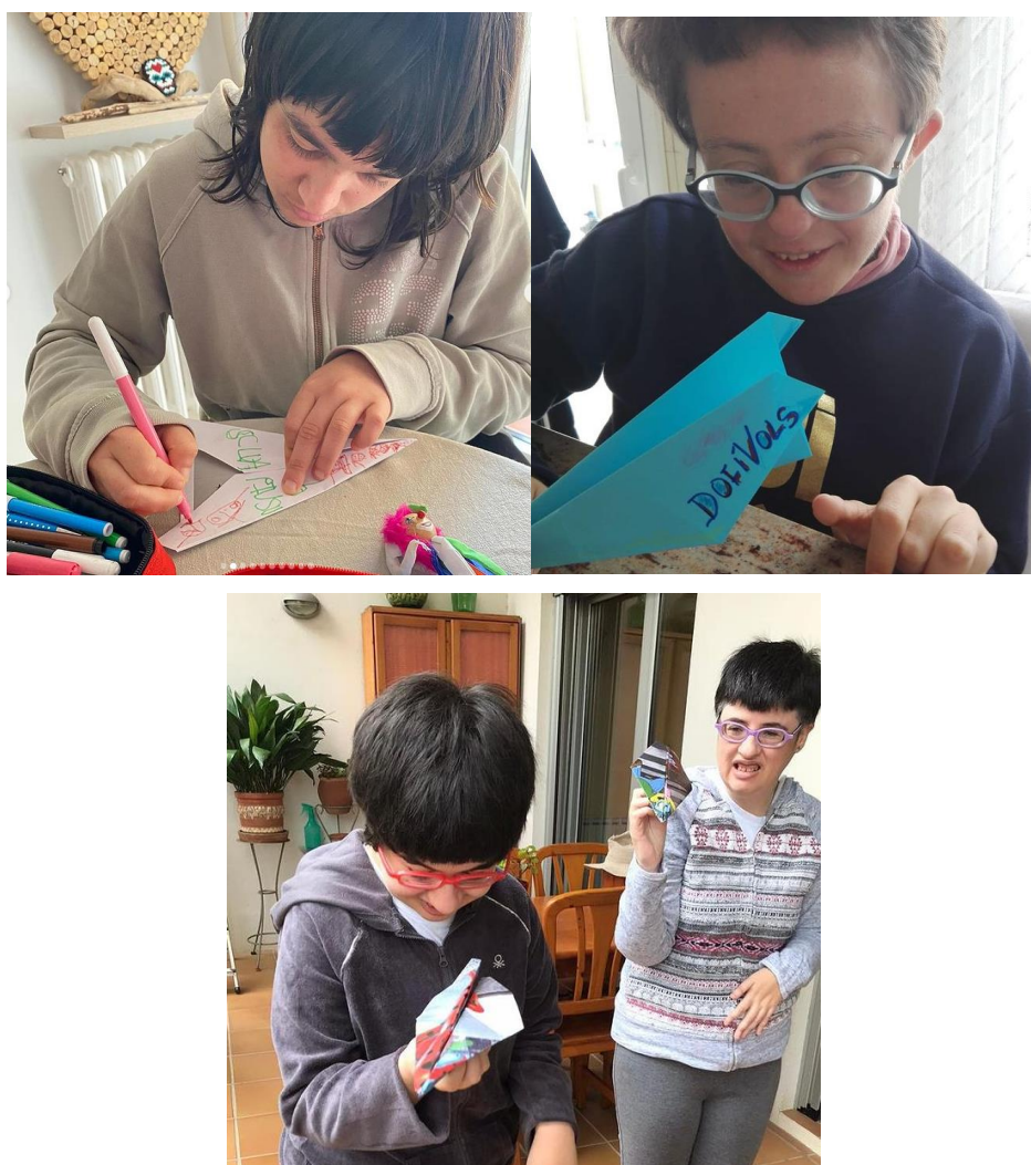
Fotografia 18, 19 i 20: Activitat telemàtica no presencial

Durant aquest 2020 s'han enviat un total de 8 activitats per via vídeo. Sobretot en els mesos de març a maig i al desembre.