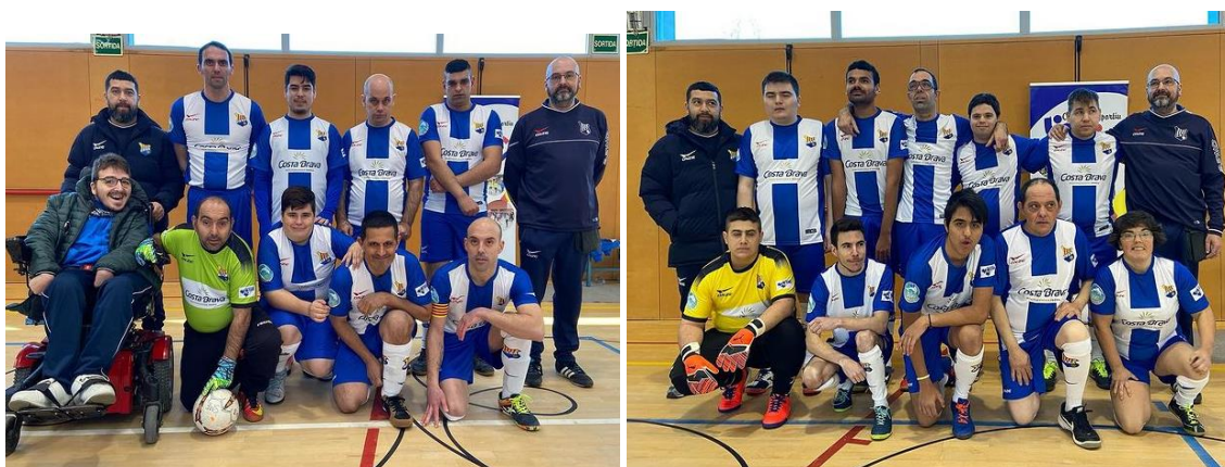
Fotografies 10 i 11: Equips del Futbol Sala Integra de la UE Figueres patrocinats per CostaBrava Frigorifics

Aquesta activitat nomès s'ha pogut realitzar els mesos de gener i febrer, i la primera setmana de març. Durant aquests dos mesos els equips de futbol van poder disputar la quarta jornada de lliga el 12 de gener a Peralada. Mentre que l'equip blau va empatar, l'equip blanc va guanyar per 12 gols a 3. En aquesta jornada els equips varen poder estrenar les noves equipacions del nostra patrocinador Costa Brava frigorificos. Malauradament i degut a la COVID-19, els equips no varen poder acabar la lliga. A més, tampoc va poder disputar el MIC Integra. A més, els equips no varen poder iniciar la temporada 2020/2021.