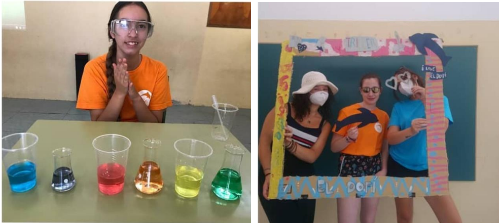
Fotografies 21 i 22: Activitats temàtiques “La Ciència” i “Hollywood”

Durant el mes de Juliol i Agost van participar al casal d'estiu 8 usuaris/es i 7 monitors/es cada mes.