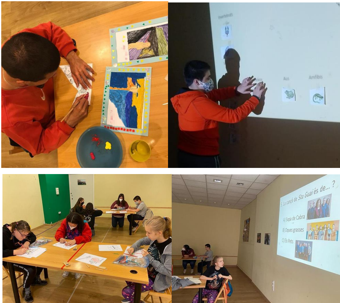
Fotografia 3, 4, 6 i 6: Activitats de dissabte realitzades al local