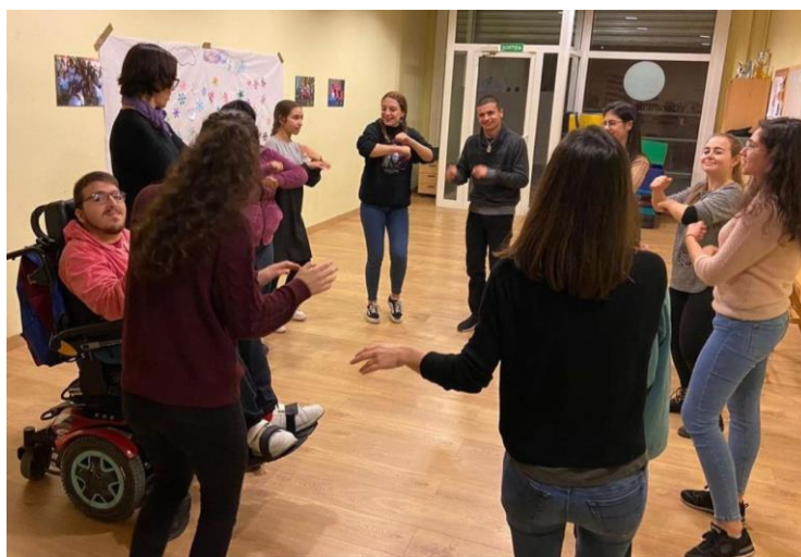
Fotografies 7 i 8: Taller de teatre