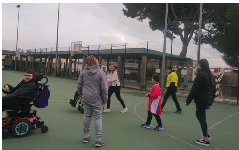
Fotografia 1: Activitat de dissabte cos en moviment realitzada a les instal·lacions esportives de Figueres