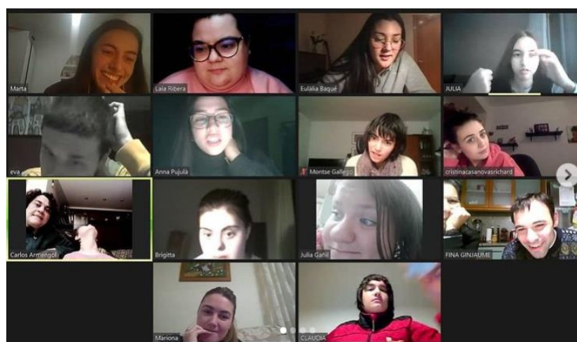
Fotografia 16, 16 i 17: Activitats telemàtiques