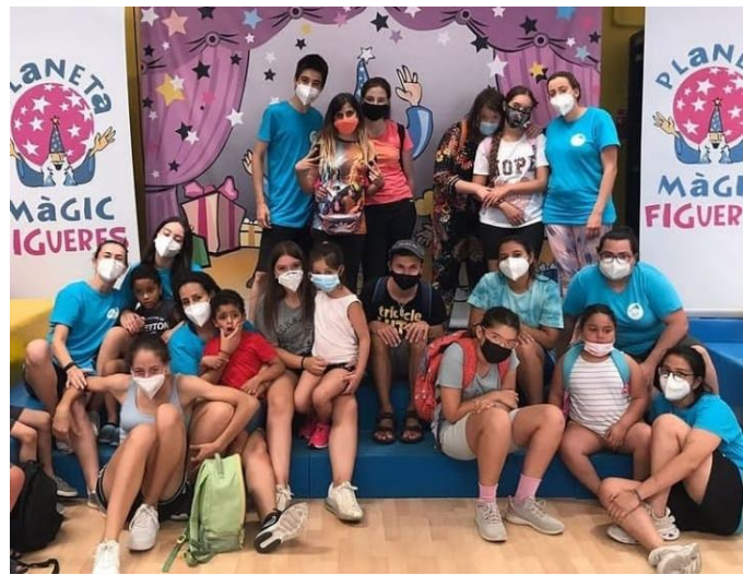
Fotografies 22 i 23: Excursions a La Farinera de Castelló d'Empúries i al Planeta Màgic