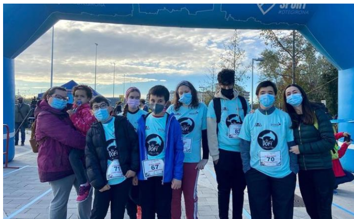
Fotografia 15 i 16: Grup d'atletes del Club Atletisme Figueres i membres que van participar a la cursa multicapacitats de Girona.