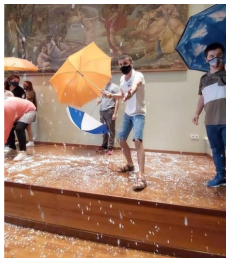
Fotografies 7 i 8: Actuacions finals del grup de teatre al Cercle Sport Figuerenc i al Teatre Jardí de Figueres

Es va fer la representació de final de temporada el mes de setembre, s'havia de fer al juny però per motius de Covid-19 es va haver d'aplaçar. Al desembre s'ha fet la representació de Nadal juntament amb la resta de grups de l'Aula de Teatre.