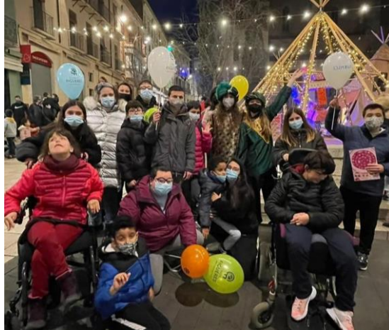
Fotografies 24 i 25: Visita als Reis Mags i a les Fires de Nadal de Figueres