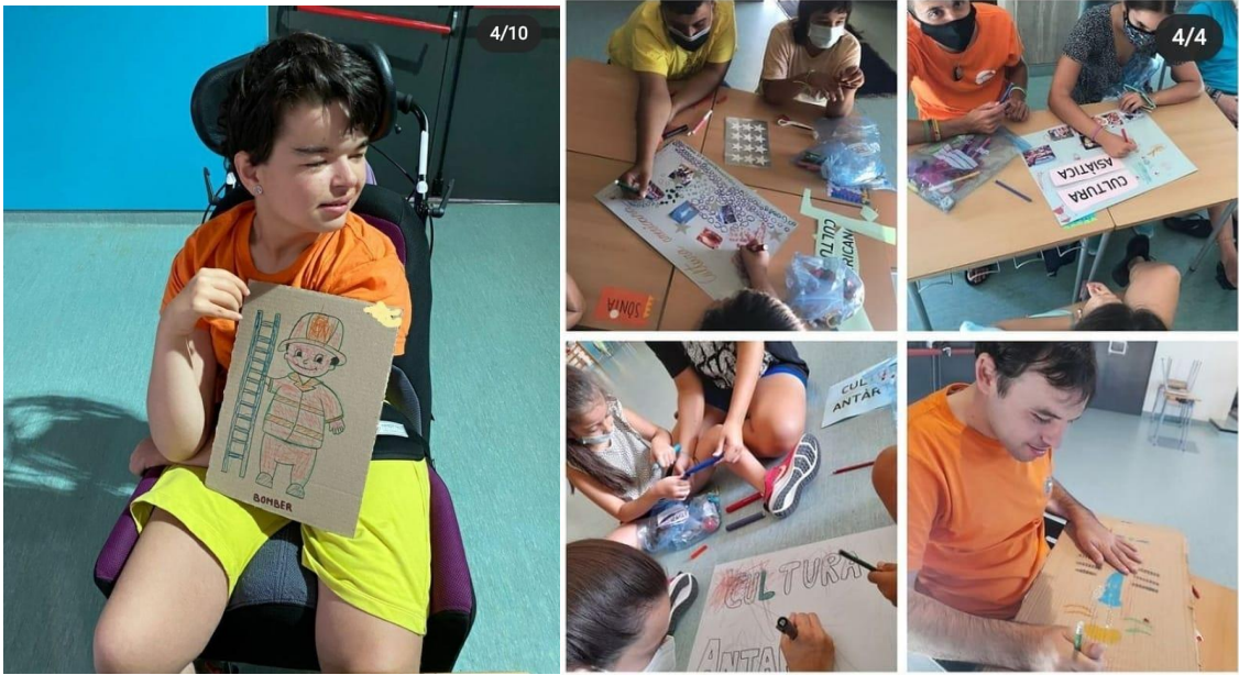
Fotografies 20 i 21: Activitats temàtiques Cultures del món i “Els oficis”