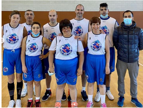
Fotografia 13 i 14: Equips del CB Adepaf amb l'equipació de l'equip patrocinat per MRW.