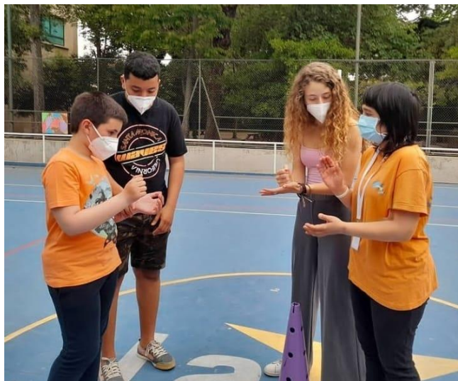
Fotografia 1: Activitat de dissabte cos en moviment realitzada a La Salle