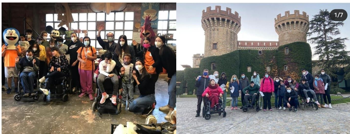
Fotografia 3 i 4: Activitats El Foraster a Navata i Peralada

d'aprendre'n les seves tradicions, festes, especialitats i gastronomia destacada. Aquest any hem decidit que ens desplaçaríem al poble a treballar per a fer l'activitat. Així, hem anat a Vilabertran, Peralada i a Navata.