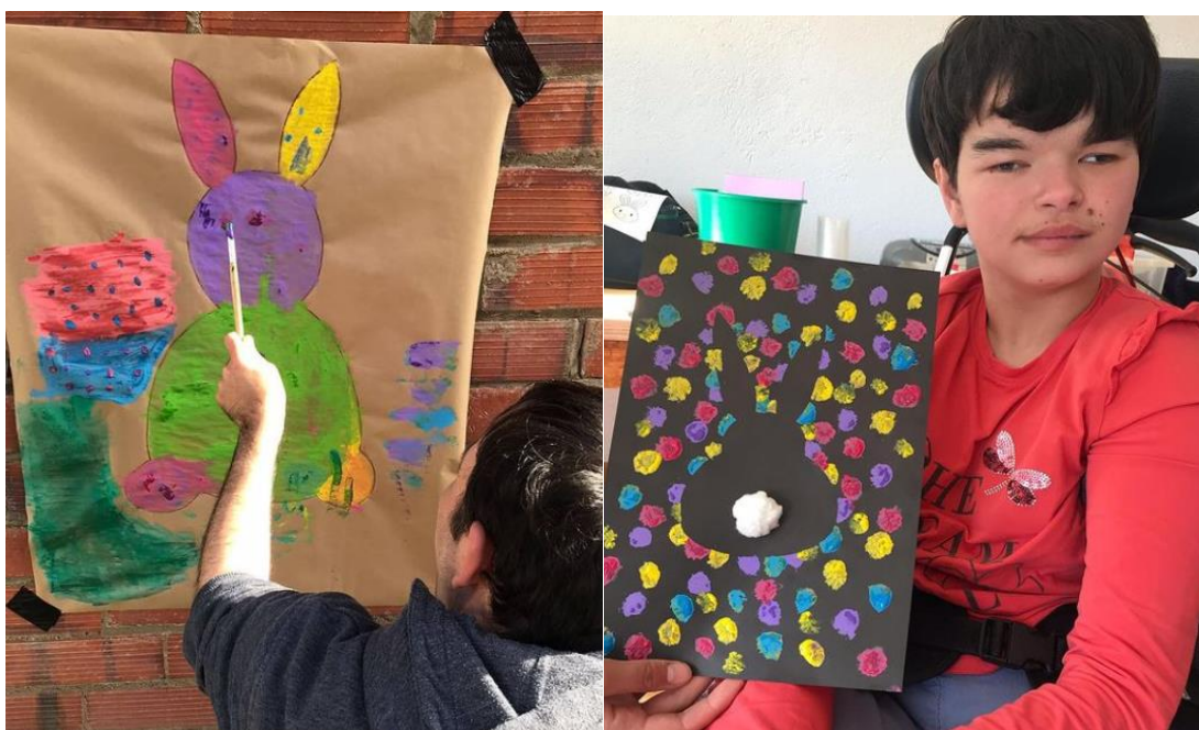
Fotografia 18 i 19: Casal setmana santa

Un total de 11 usuaris van participar al casal de setmana Santa.