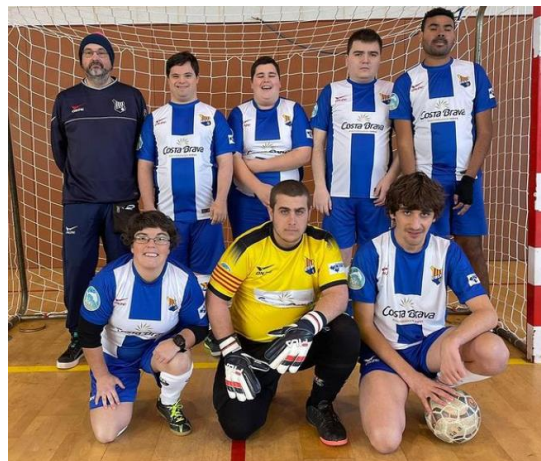
Fotografies 11 i 12: Equips patrocinats per CostaBrava Mediterranean food.