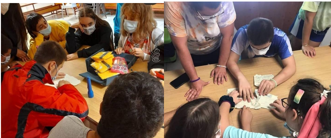
Fotografies 26 i 27: Cerca del tresor a la casa de colònies Cal Ferrer