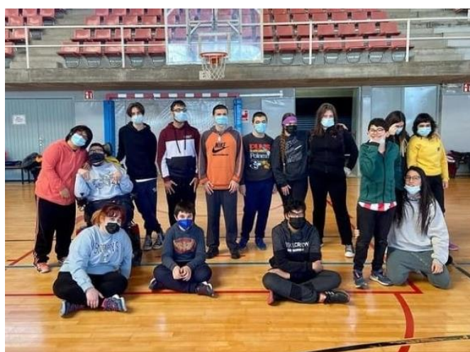
Fotografies 9 i 10: Activitats de tennis i bàsquet d'esport a l'Abast