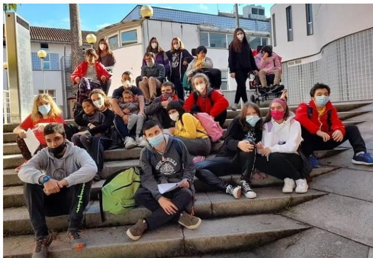
Fotografia 17: Excursió a Olot