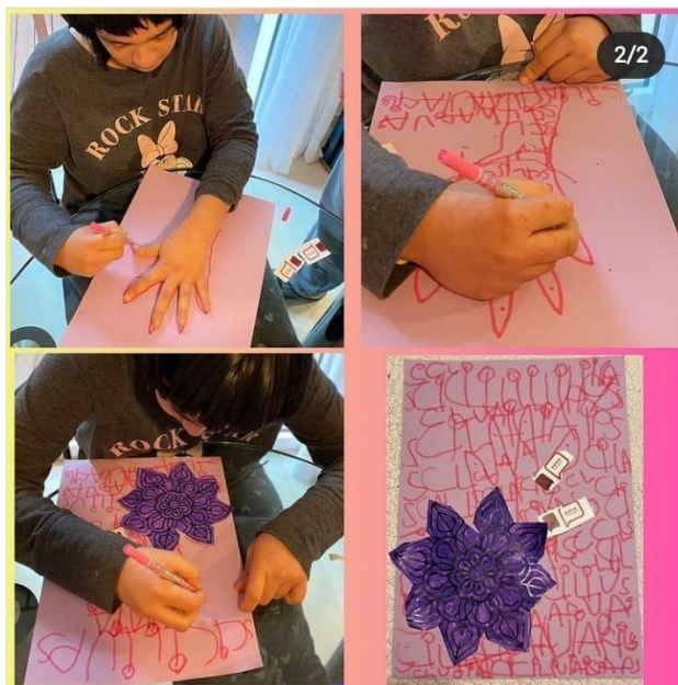
Fotografia 6: Activitats telemàtiques no presencial de Sant Jordi

Durant l'inici d'aquest 2021 s'han enviat un total de 3 activitats per via vídeo.