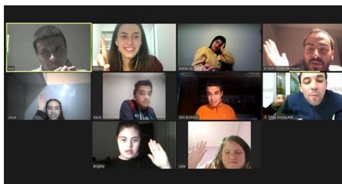
Fotografia 5: Activitats telemàtiques

Amb la finalitat d'adaptar les activitats del centre a la situació d'excepcionalitat deguda a la COVID-19 es va optar per la realització d'activitats telemàtiques els dissabtes de 18:00h a 19:00h durant els mesos de gener a març. A les activitats hi han participat un total de 14 usuaris/es diferents amb una mitjana de 8 usuaris/es per activitat.