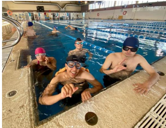
Fotografies 5 i 6: Activitats d'atletisme i piscina d'esport a l'Abast