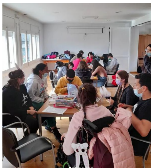
Fotografies 13 i 14: Casal setmana santa