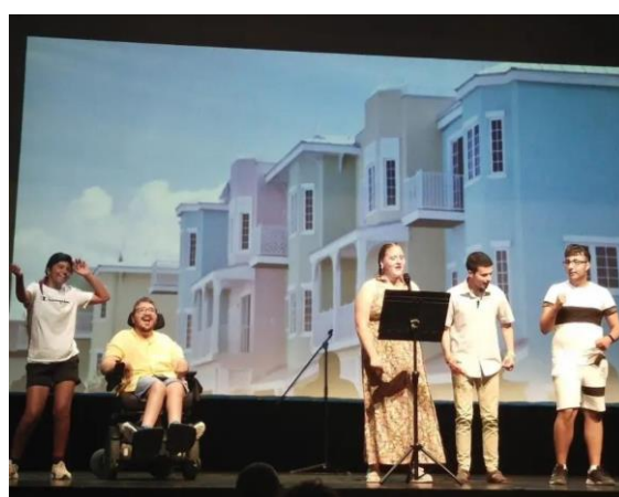
Fotografies 3 i 4: Assaig del grup de teatre al Casal Cívic Joaquim Xirau i actuació final al Teatre Jardí de Figueres

Es va fer la representació de final de temporada el mes de juny i al desembre s'ha fet la representació de Nadal juntament amb la resta de grups de l'Aula de Teatre.