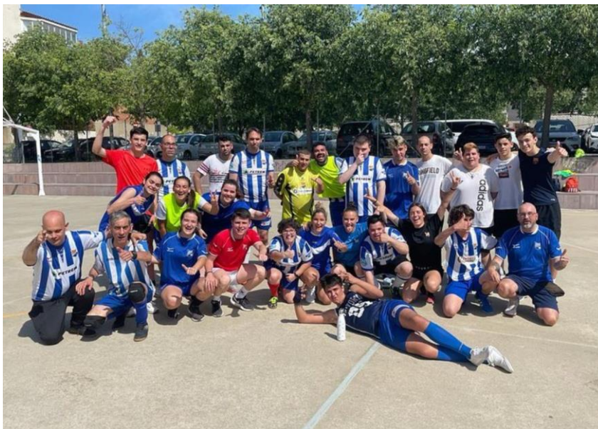
Fotografia 7: Torneig inclusiu dels equips del futbol integra i de les jugadores del primer equip de la UE Figueres patrocinat amb Costabrava Mediterranean Food.

Aquest any, els equips de futbol integra van realitzar un torneig inclusiu juntament amb les jugadores del primer equip femení de la UE Figueres.