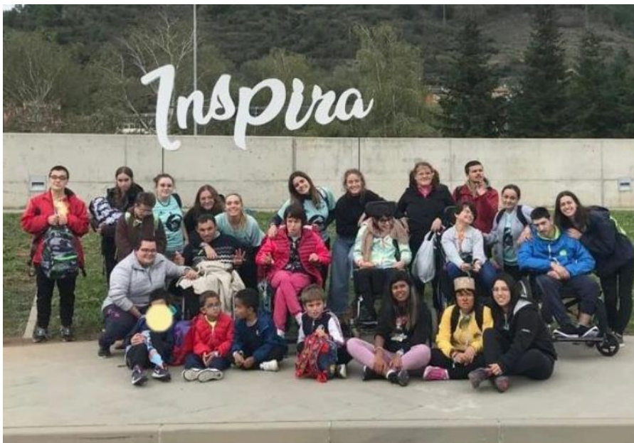
Fotografia 12: Excursió al festival Inspira a Ripoll

Aquest any 2022 hem realitzat tres excursions: el mes de febrer vam anar al Màgic món dels trens de Santa Eugènia de Berga, el mes de juny vam anar al Càmping Laguna de Castelló d'Empúries i el mes d'octubre vam assistir al Festival inclusiu Inspira realitzat a Ripoll que organitza la Fundació MAP.