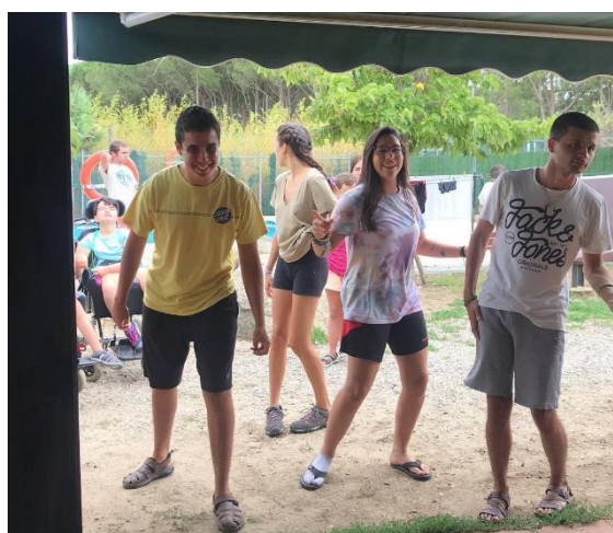
Fotografies 19 i 20: Colònies al Casal de l'Albera