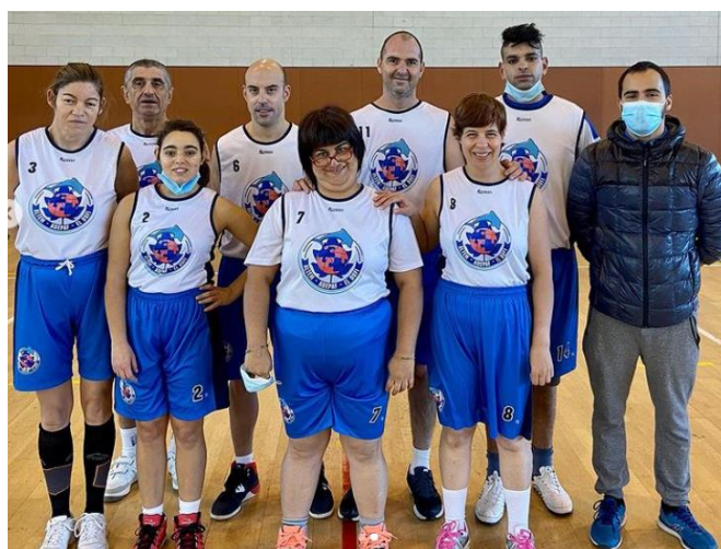
Fotografia 8 i 9: Equips del CB Adepaf amb l'equipació de l'equip patrocinat per MRW.