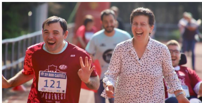
Fotografies 10 i 11: Cursa adaptada del Castell de Figueres