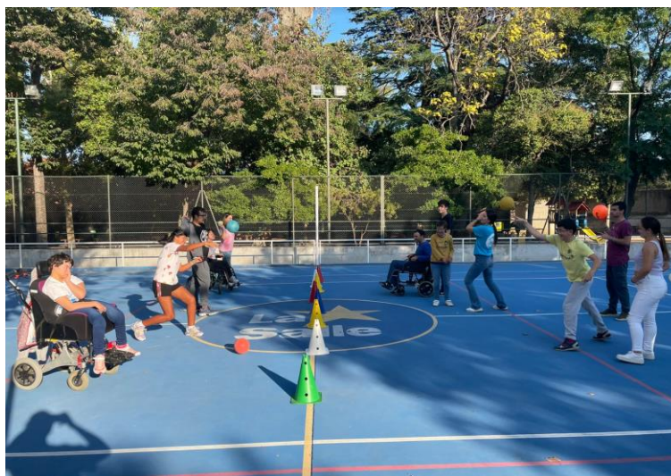
Fotografia 1: Activitat de dissabte cos en moviment realitzada a La Salle